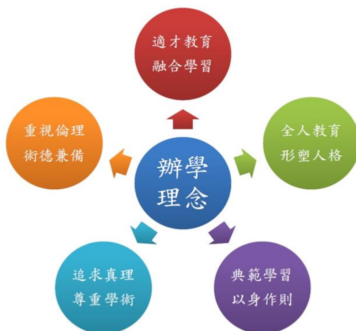
圖 1-1 台灣首府大學辦學理念

如圖 2-1 台灣首府大學辦學理念所示，本校係以發展成為優質的教學型休閒產業大學為其願景與目標。辦學理念則以「適才教育、融合學習」、「全人教育、形塑人格」、「典範學習、以身作則」、「追求真理、尊重學術」、「重視倫理、術德兼備」為尚，期望能深入發展學生潛能，培育社會中堅人才。根據本校辦學理念及本所設立宗旨「人才培育、教育領航」，經多次所務會議不斷確認決議，本所係以「培育具有教育專業研究能力之行政決策與課程教學人才」為教育目標，使學生具備教育專業能力、行政決策能力、課程教學能力、實務應用能力、教育思辨能力、教育批判能力等六大核心能力。學生學習成效除授課教師之多元性、形成性與期中評量外，亦進行期末學習評量與成效分析。課程規劃經過三級三審之課程委員會審核通過，學生畢業必須修習包括專業必修、專業選修、分類選修等課程至少 38 學分，並通過論文計畫口試與碩士論文考試及格，始能取得碩士學位。